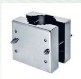
Mastmontageadapter, zusammen mit Wandmontagearm, Artikelnr. 2301A05112