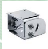
Schwenkfuß, zusammen mit Säulenmontage Artikelnr. 2301A05111