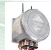
Medienbox, Artikelnr. 2301A05220

Für beide Gehäusetypen sind Hybridkabel verfügbar.