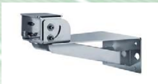
Wandmontage, Artikelnr. 2301A05110

Für das LWIR-Gehäuse sind verschiedene Zubehörteile erhältlich: