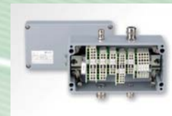
Klemmbox, Artikelnr. 2301A05210