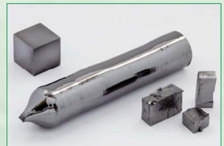
Links: Schema Kristallzucht Oben: Ingot